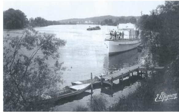
Le bateau de croisière « Le Lady Constance » à quai (1930/1940 environ)