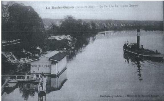
Le port de La Roche-Guyon