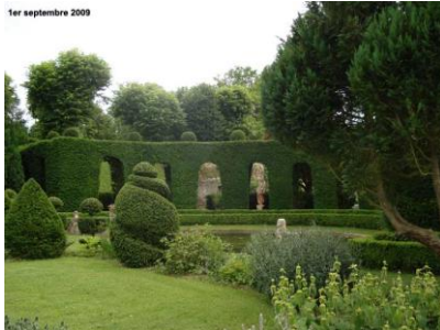
Ambleville , et son parc classé « jardin remarquable »

et, dans le sillage de Ninon de Lenclos, Omerville , dont Louis de Mornay, acquiert le manoir pour y abriter un temps ses amours avec Ninon de Lenclos avant de s'installer au domaine de Villarceaux , château qui accueillit également Françoise d'Aubigné, future Madame de Maintenon.