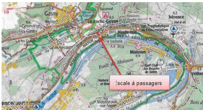
Emplacement sur lequel le projet va être réalisé

Cet ensemble présente un potentiel touristique important tant pour le parc naturel du Vexin, pour le château que pour l'économie du village