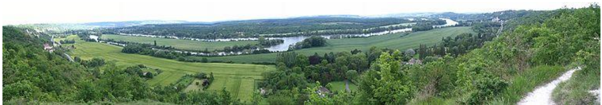
La Roche-Guyon : site Natura 2000 des Coteaux et boucle de la Seine.

Les falaises de la Roche-Guyon constituent un site naturel classé.