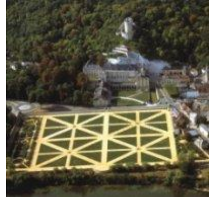
Le potager du château