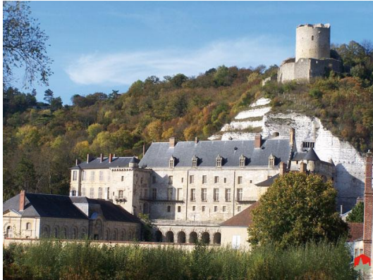
Le château de La Roche-Guyon

Ce n'est pas sans raison que la Roche-Guyon est classé parmi les « Plus Beaux Villages de France » puisque, au-delà de sa situation environnementale exceptionnelle, la commune compte plusieurs monuments historiques, classés ou inscrits, sur son territoire :