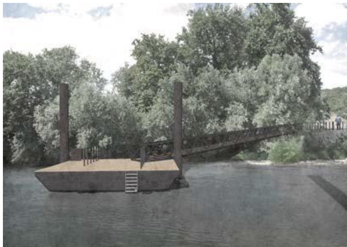
Photomontage du futur ponton

ENQUETE PUBLIQUE réalisée du 17 octobre au 19 novembre 2016 (arrêté préfectoral du 14 septembre 2016)