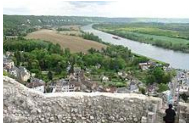
Le site vu du donjon vers l'amont de la vallée de la Seine

Les objectifs du projet visent à renforcer l'attractivité touristique du château par un mode de tourisme durable et à préserver la valeur patrimoniale et environnementale du site.