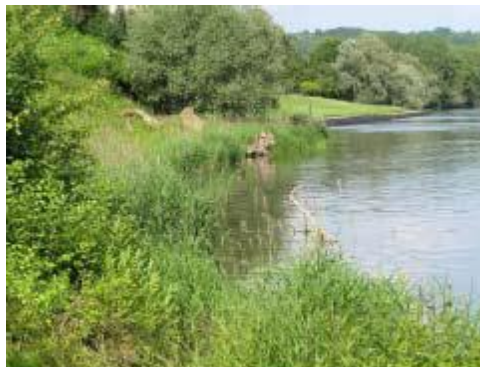
Berge naturelle à l'aval du site

L'étude des trames vertes et bleues fait apparaître que le périmètre du projet est essentiel pour le maintien des populations des espèces liées aux milieux aquatiques.