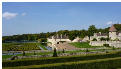
Domaine de Villarceaux, ses jardins et plans d'eau